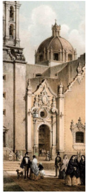
En 1715 Sumaya c

Su legado musical no sólo incluye La Parténope (cuya partitura está perdida) y un fondo litúrgico impresionante, sino también la educación de uno de los mayores músicos de la colonia: Juan Mathías de los Reyes, (ca. 1720- 1779), cantante, arpista, organista y compositor oaxaqueño, a quien Sumaya heredó no solo sus conocimientos, sino su propio puesto. Mathías de los Reyes escribirá una cantidad considerable de obras vocales pero no se sabe si incursionó en la ópera propiamente dicha. Aún así, se debe a él la difusión de la técnica vocal coral que hizo posible el desarrollo de la polifonía en Oaxaca durante casi dos siglos.