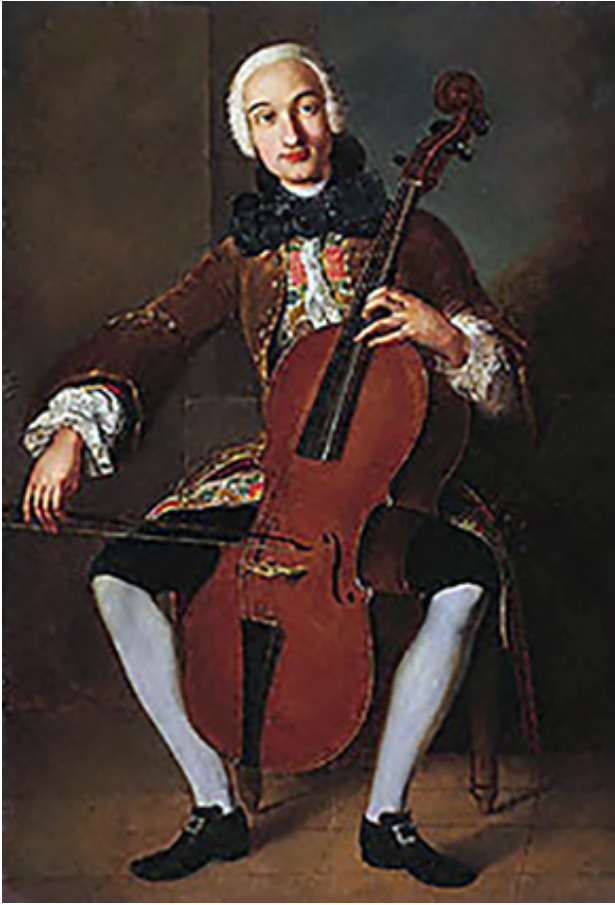
Manuel de Sumaya (1680-1755), el primer compositor de ópera nacido en el continente americano

Este virrey, además de haber propiciado el nacimiento de la ópera en América, pasó a la historia por haber vivido desastres naturales cuyos efectos en los pobladores palió incluso con dinero de su propio bolsillo, lo cual no era frecuente ni entonces ni ahora. [Se sabe que durante su gobierno la capital sufrió de una nevada, cosa extraordinaria en la región, y un terremoto, que sí es un fenómeno común.]